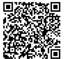
報名 QR code