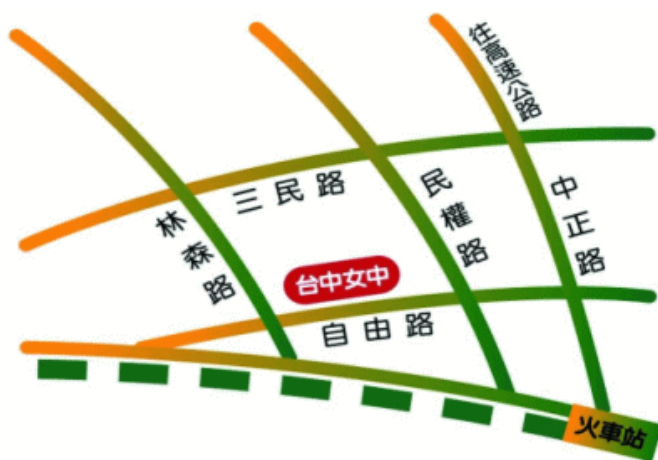
臺中市立臺中女子高級中等學校 110 學年度校園配置圖