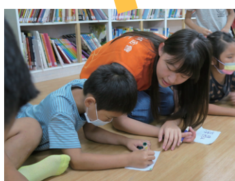
小孩的每一筆每一劃， 都能感受到他們對於我們的期待。