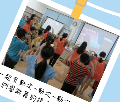
一起來動次~動次~動次~ 他們學跳舞的樣子太可愛啦!

從身心障礙者就學、就業等權益倡導，進而到發展遲緩兒童的早期療育服務、高齡長者的照護.....等，提供身、心、靈的全人社會福利服務，讓福音與福利得以實踐。