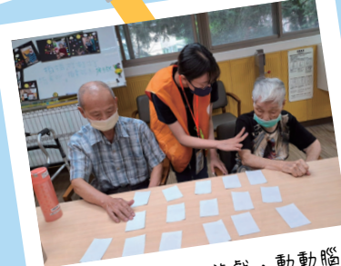
跟著長輩一起玩遊戲，動動腦~ 玩到差點忘記要吃飯XD