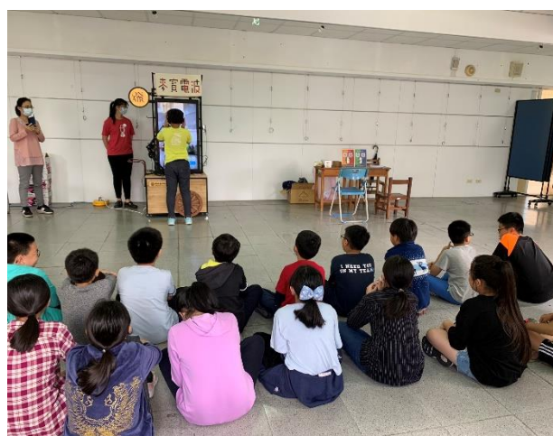
麥寶電波體驗活動紀實 1