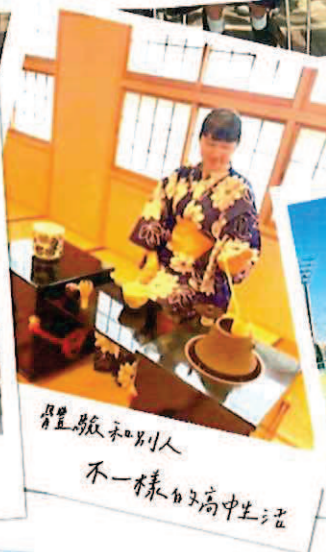
尊重自己和別人 不一樣的高中生活