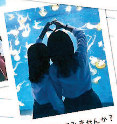
日本留学してみませんか?