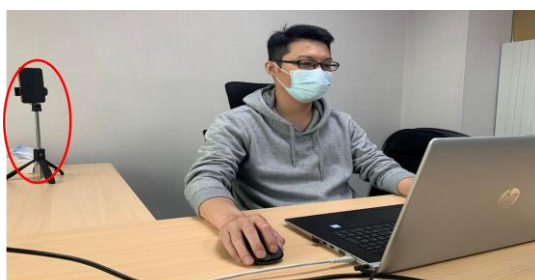
測驗期間需全程開啟視訊及麥克風，並將把手機放置於您坐定的座位斜後方的平台四點鐘或八點鐘方向