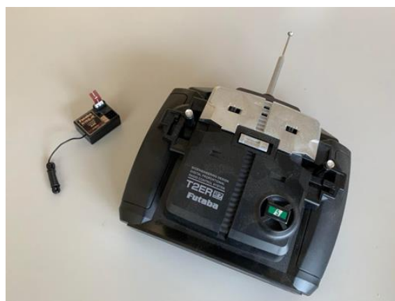
市售 3 通道 27MHz 板型遙控收發器