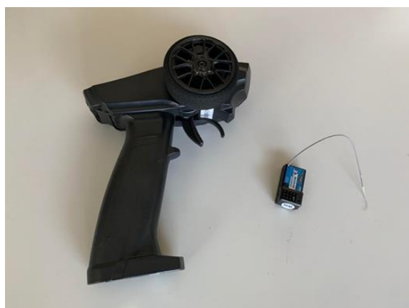
市售 3 通道 2.4GHz 槍型遙控收發器

本競賽禁止使用市售 2 通道、3 通道或多通道之 2.4GHz、27MHz (或其他頻率) 槍型或板型遙控收發器 (或由類似控制元件組合) 作為控制遙控帆船之裝置 (如下二圖所示)，違者以 失格 認定。