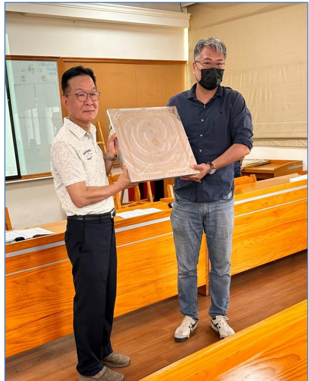
機械科團隊使用 CNC 車床製作象棋棋盤一組，致贈校長恭賀退休