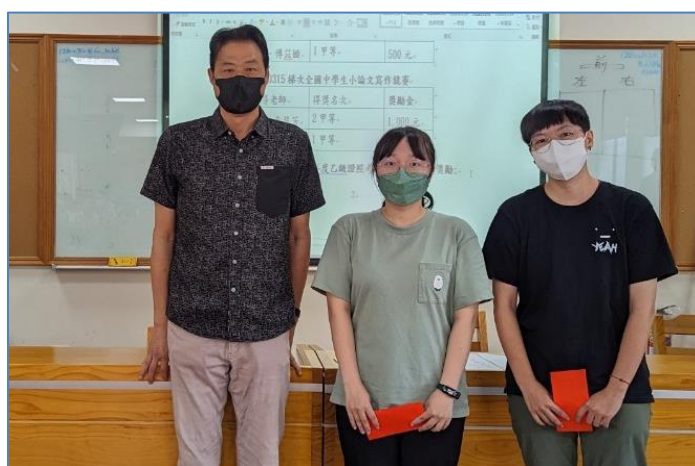
頒發 1120315 梯次全國中學生小論文寫作競賽 指導老師獎勵金