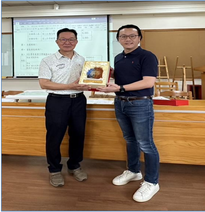
沈校長即將於 8 月 1 日退休，由家長會長代表家長會致贈禮品給校長