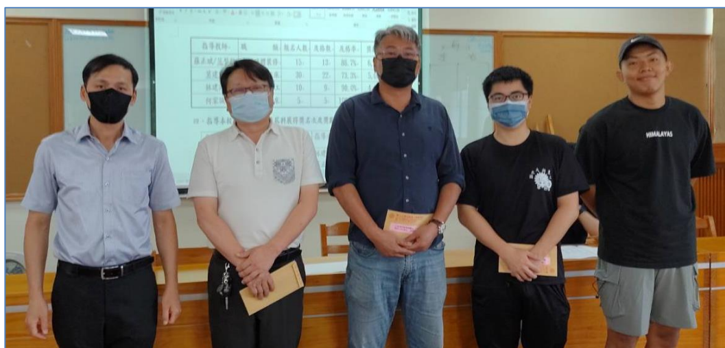
頒發 111 學年度乙級證照考試 指導教師績優獎勵金