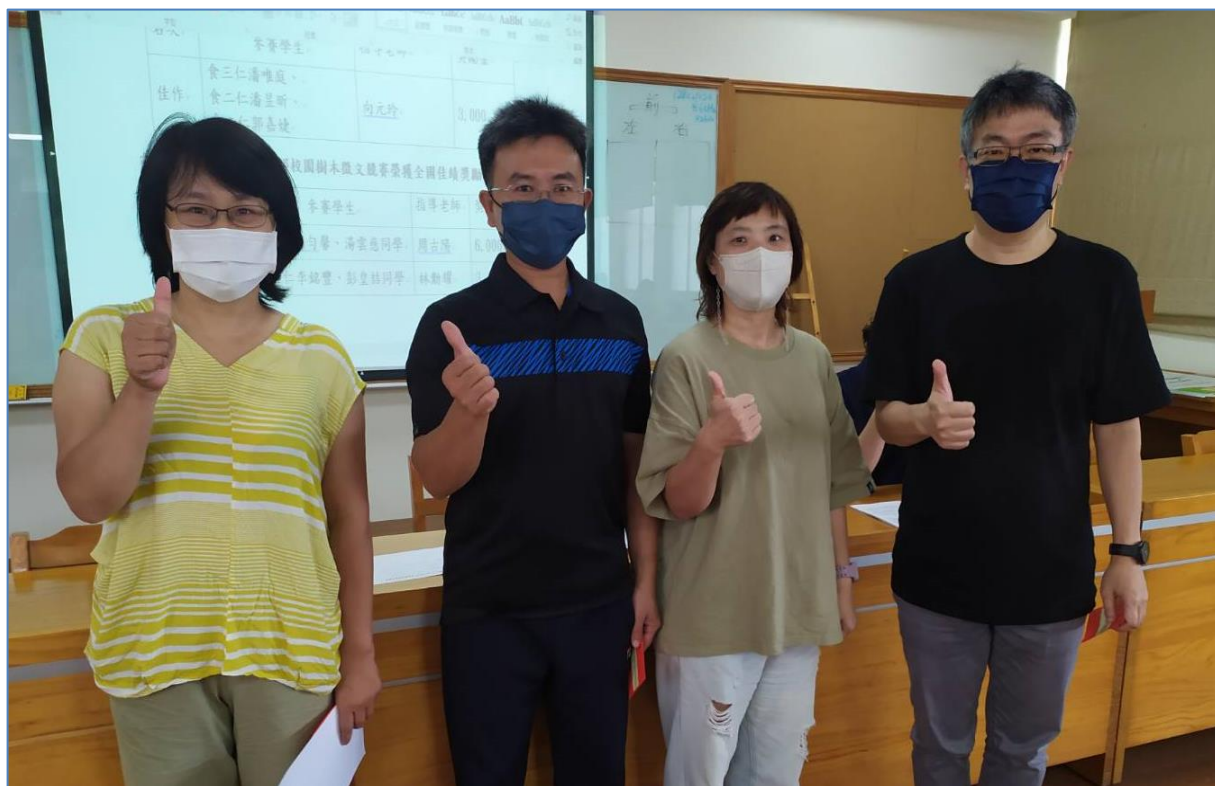
頒發指導學生參加全國客家藝文競賽—客語對話榮獲佳作 及指導學生參加教育部校園樹木徵文競賽榮獲全國佳績 指導老師獎勵金