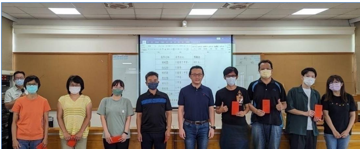
頒發 1120310 梯次全國中學生閱讀心得寫作競賽 指導老師獎勵金