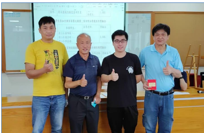
頒發指導學生參加第 63 屆科展得獎 指導老師獎勵金