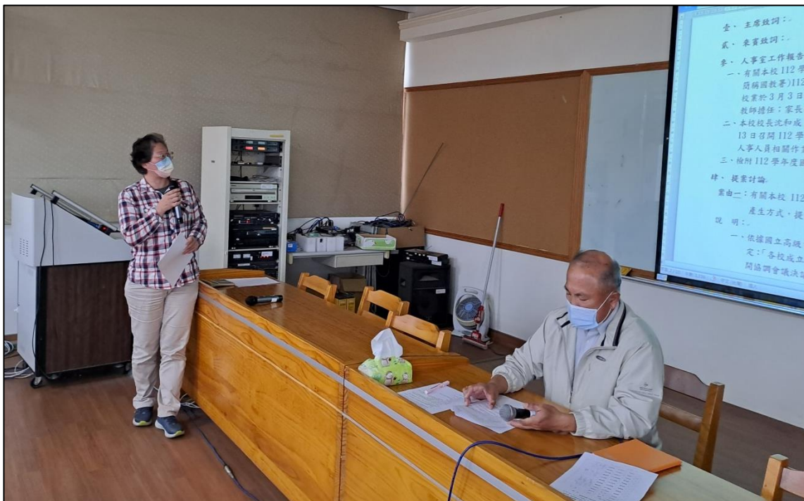
人事主任業務報告