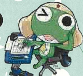
應援角色 Keroro軍曹