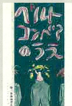
故事漫畫【自由組】 作品名:在傳送帶上 筆名:NARUHANOTO