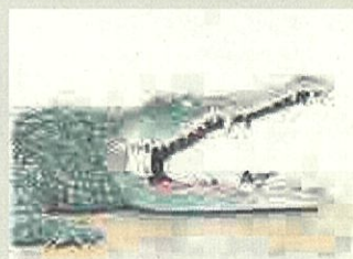
單頁漫畫【自由部門】(約定) 作品名:鱈魚與牙籤鳥的約定 筆名:小林尚武(NAOTAKE)